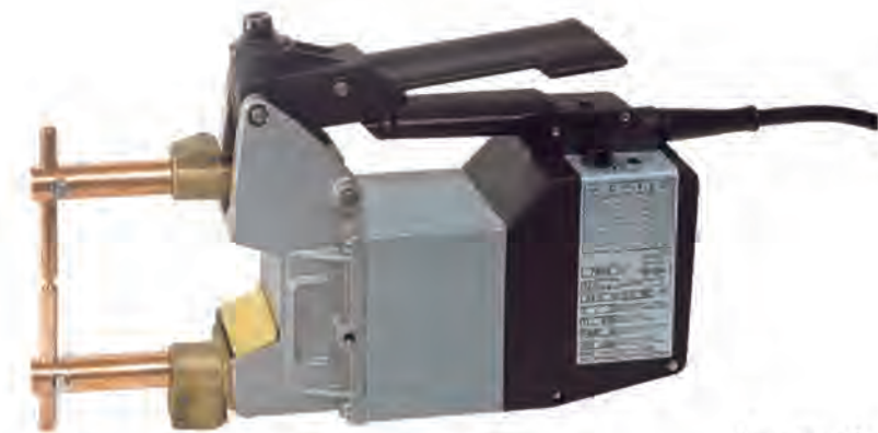
Art. 7902 P